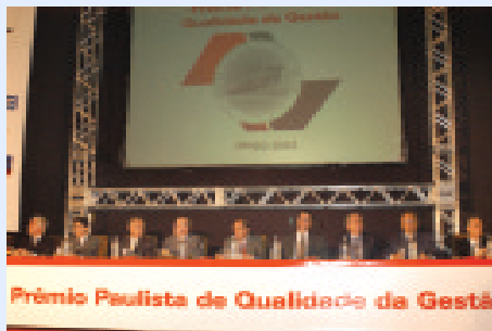
a cerimônia de entrega do PPQG contou com a presença de representantes do governo estadual, das empresas e do IPEG