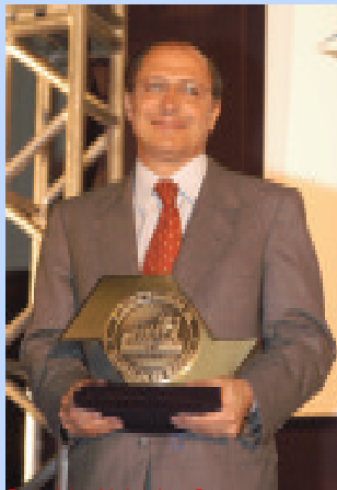
Geraldo Alckmin, Governador de São Paulo, com o Troféu Governador do Estado

Hoje nós podemos dizer que esta terra ( São Paulo ) de tantas siglas fantásticas tem hoje mais uma sigla que se incorpora a esta história bandeirante. Que hoje é bandeirante na tecnologia, no conhecimento e na ciência, que é o IPEG, o Instituto Paulista de Excelência da Gestão. O IPEG mostra a sua visão de futuro e institui esse prêmio paulista de qualidade que é a garantia de que nós vamos ter um futuro com muito mais desenvolvimento.