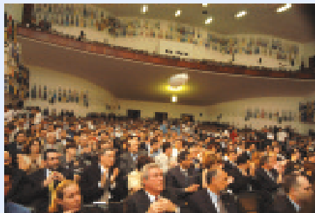
o público, formado pelos funcionários das empresas, mostrou que “vestiu a camisa”

Governo estadual. Nas próximas páginas você fica sabendo como são os critérios do IPEG para escolher as empresas ganhadoras, quem são os avaliadores, os nomes de todas as organizações ganhadoras e o pensamento dos principais envolvidos com o PPQG 2003.