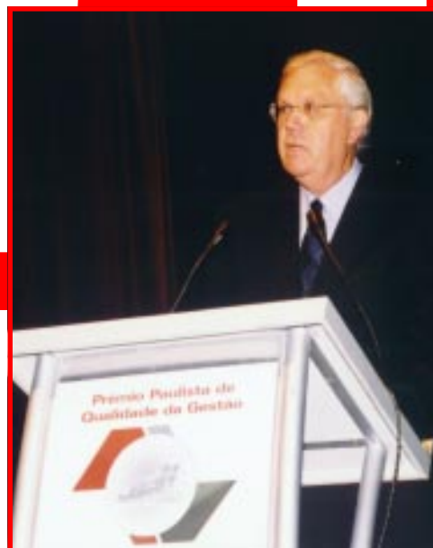
O jornalista Joelmir Beting foi o apresentador da cerimônia.